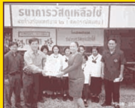
ธนาคารขยะ