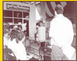
ศูนย์วัสดุรีไซเคิลของชุมชน