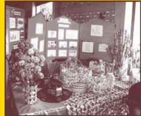
สิ่งประดิษฐ์จากวัสดุเหลือใช้