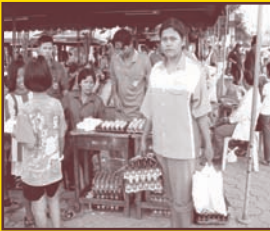
ขยะแลกไข่, สิ่งของ

พอจะทราบกันแล้วว่าขยะที่สามารถนำมาใช้ประโยชน์ได้หรือที่เรียกว่า ขยะรีไซเคิล เราสามารถนำมาทำกิจกรรมภายในชุมชนได้หลายกิจกรรมเพื่อให้ชุมชนน่าอยู่และมีสิ่งแวดล้อมที่ดี ซึ่งยกตัวอย่างได้ดังนี้