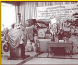
น้ำปารีไซเคิล