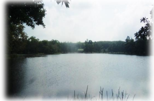
แหล่งน้ำหนองเหมา