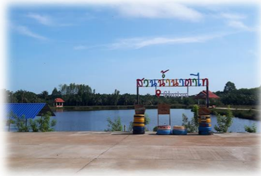
สวนน้ำนาตาไท

ตำบลเวียง มีแหล่งน้ำที่สร้างขึ้นหลายแห่ง ได้แก่ ฝาย สระเก็บน้ำ สถานีผลิตน้ำประปา (ประปาหมู่บ้าน) บ่อน้ำตื้นสาธารณะ และบ่อบาดาล